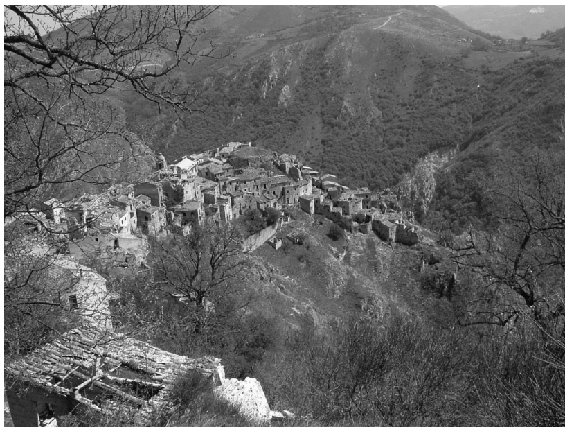
■ Il vecchio Borgo abbandonato dopo il terremoto

La riqualificazione urbanistica delle aree ha come finalità il recupero dell'intero ambiente urbano con azioni integrate volte al capovolgimento del degrado urbano a livello economico, sociale e fisico, ai fini del conseguimento della sostenibilità per questo paese, di cui è espressione pro-